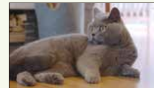
デポーシ醸造所のマスコットワチエちゃん